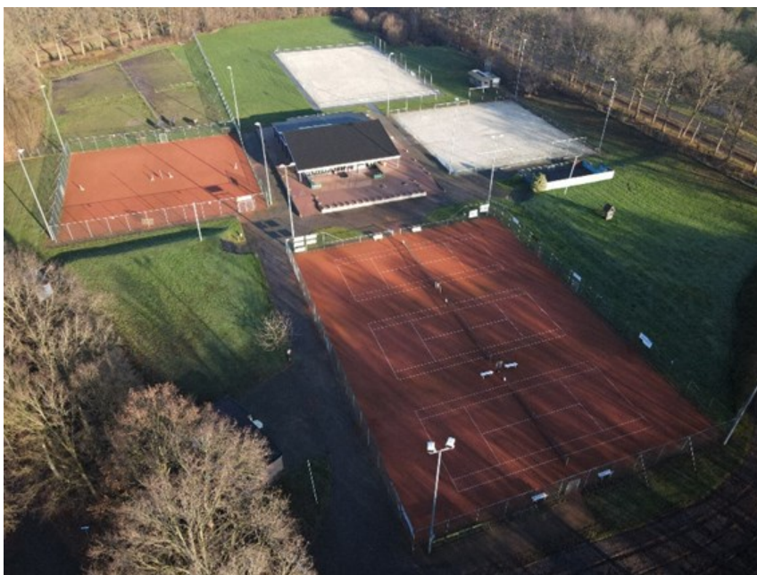
“Sportpark de Borgen”